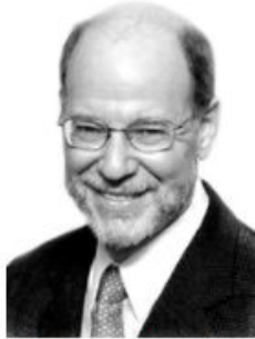
H. Robert Horvitz Prize share: 1/3