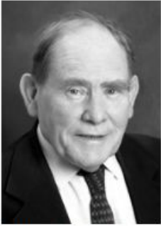
Sydney Brenner Prize share: 1/3