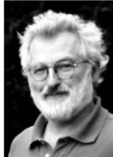
John E. Sulston Prize share: 1/3

The Nobel Prize in Physiology or Medicine 2002 was awarded jointly to Sydney Brenner, H. Robert Horvitz and John E. Sulston "for their discoveries concerning genetic regulation of organ development and programmed cell death" .