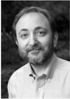
Andrew Z. Fire Prize share: 1/2