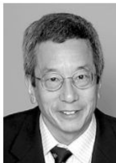
Roger Y. Tsien Prize share: 1/3

The Nobel Prize in Chemistry 2008 was awarded jointly to Osamu Shimomura, Martin Chalfie and Roger Y. Tsien " for the discovery and development of the green fluorescent protein, GFP ".